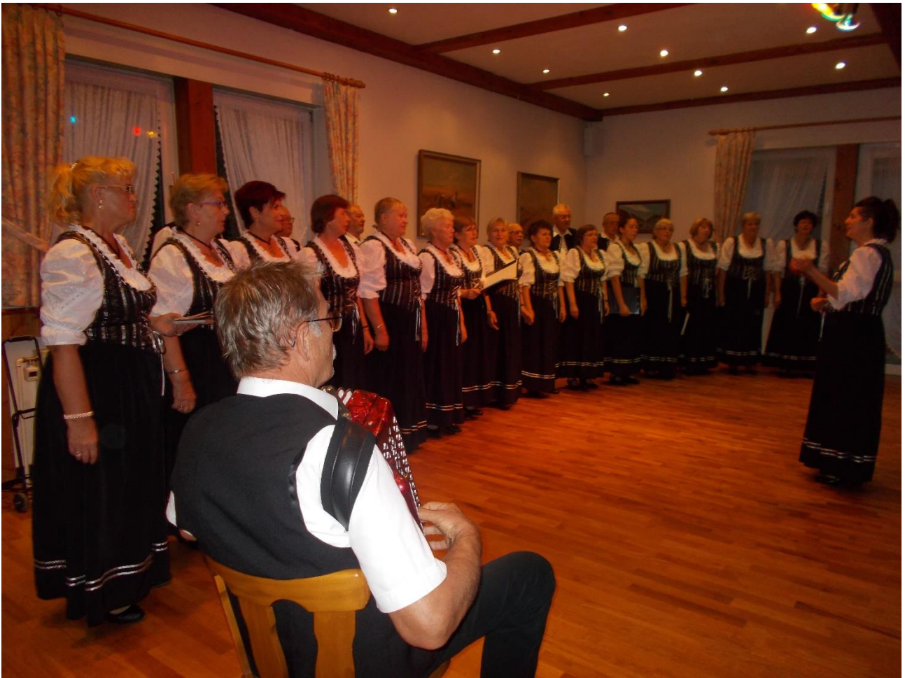
Pannonia Haus, Speyer