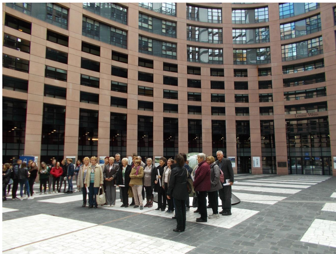
Európa Parlament - Agóra tér, Straßburg