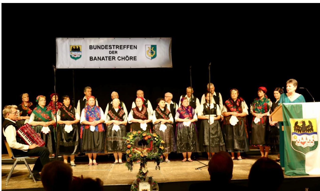
22. Bánáti Kórusok Kórustalálkozója, Gersthofen