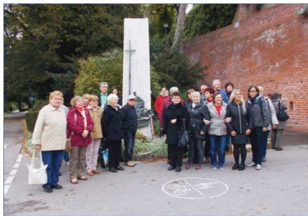
Am Auswandererdenkmal in Ulm