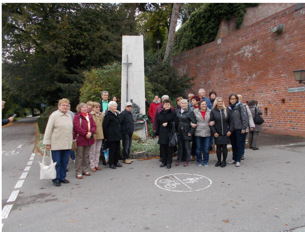
Kivándorlási emlékmű koszorúzása és éneklés, Ulm