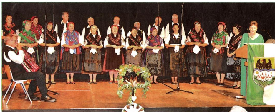
Der „Mondschein“-Chor der Deutschen Nationalitätenselbstverwaltung aus Szekszárd (Ungarn) nahm als Gastchor am Bundestreffen der Banater Chöre in Gersthofen teil.

Mit den Chortreffen wurde bereits 1997 eine Veranstaltungsreihe ins Leben gerufen, die bis heute fortgesetzt wird und in diesem Jahr ihre 22. Auflage erlebte. Nach den ersten Bundestreffen der Banater Chöre und Singgruppen in Frankenthal, Karlsruhe, Bühl, Gersthofen und Homburg/Saar hat sich ab 2003 Gersthofen in der Nähe von Augsburg als Austragungs-