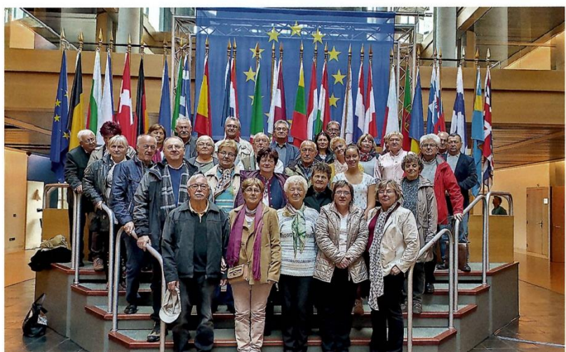
Der Szekszárdi Deutsche Chor in Europaparlament in Straßburg