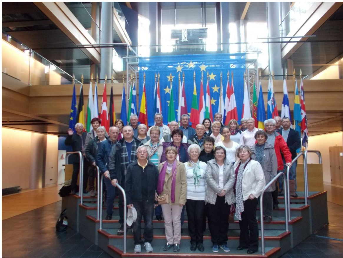
Európa Parlament, Straßburg