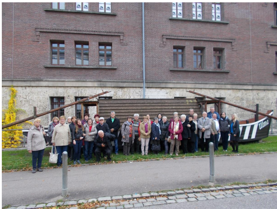
Dunamenti Svábok Központi Múzeuma, Ulm