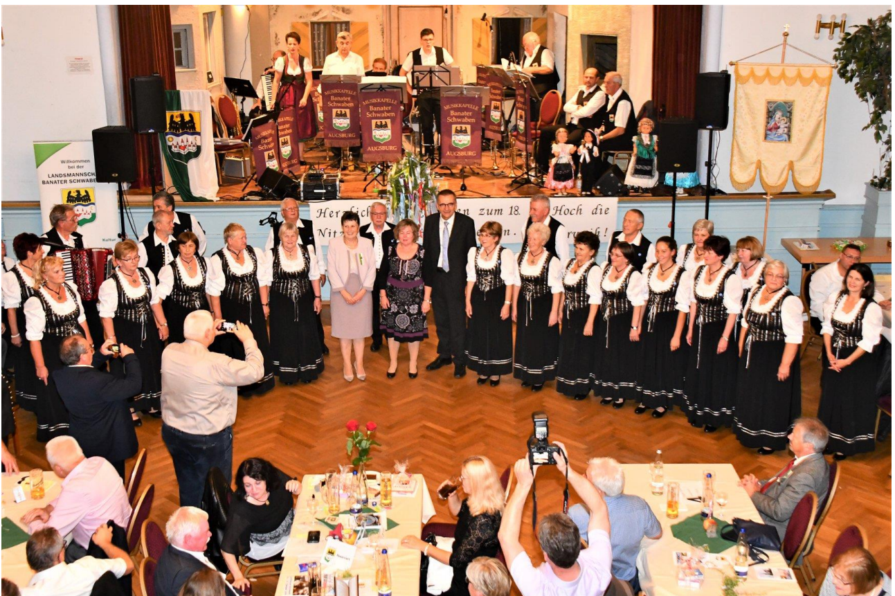
18. Heimattreffen, Nitzkydorf