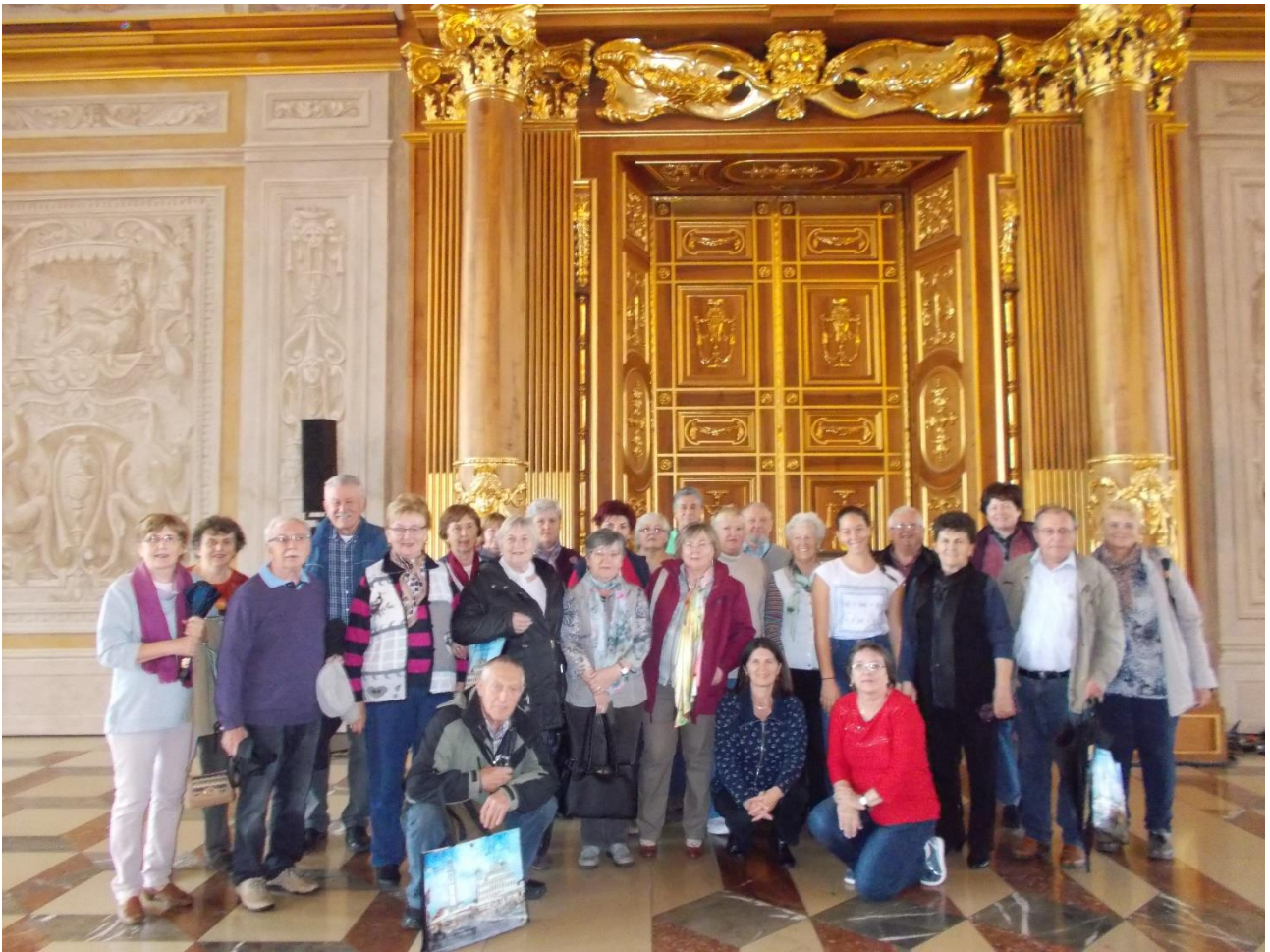
Az „Arany teremben” (Goldener Saal), Augsburg