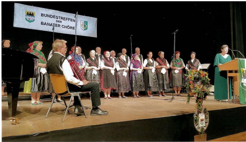
Der Szekszárdi Deutsche Chor am Chortreffen der Banater Chöre in Gersthofen