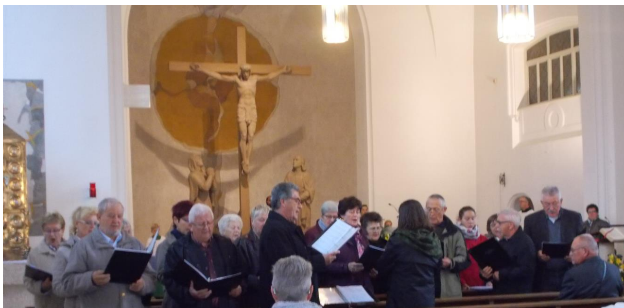
Német mise, Augsburg